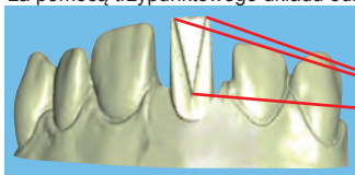
Trzypunktowy układ odniesienia

Położenie i osiowa orientacja implantu na modelu jest wirtualnie określana za pomocą trzypunktowego układu odniesienia.